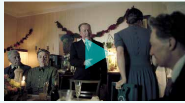
Streitgespräch bei der Geburtstagsfeier Passwort: DstSG35