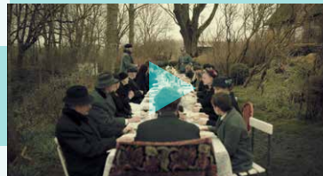
Bei der Beerdigungsfeier von Ditte Passwort: DstBD130

Teilt euch in vier Gruppen ein und seht euch jeweils einen Filmausschnitt an.