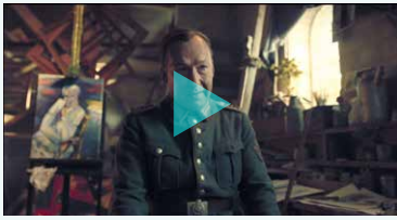
Das Malverbot Passwort: DstMV09