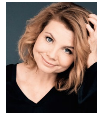
ANNETTE FRIER Rolle: Gitti