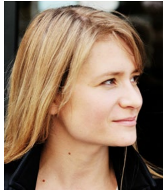
JULIA JENTSCH Rolle: Marie