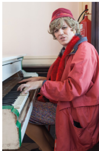
BABKA Z OSTRAVY Martin