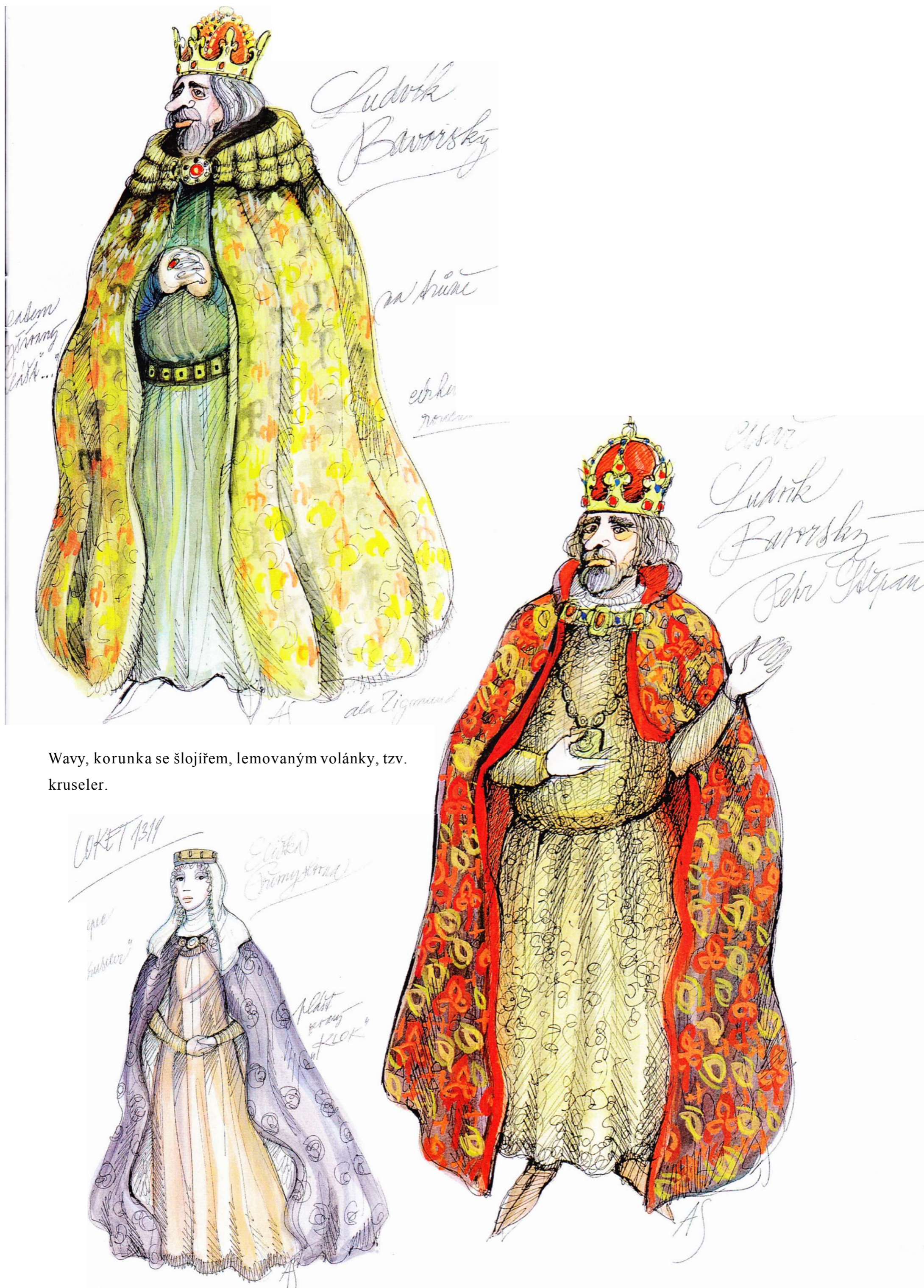
Wavy, korunka se šlojířem, lemovaným volánky, tzv. kruseler.