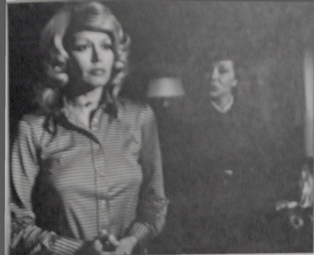
TERESA GIMPERA - MARIA ASQUERINO