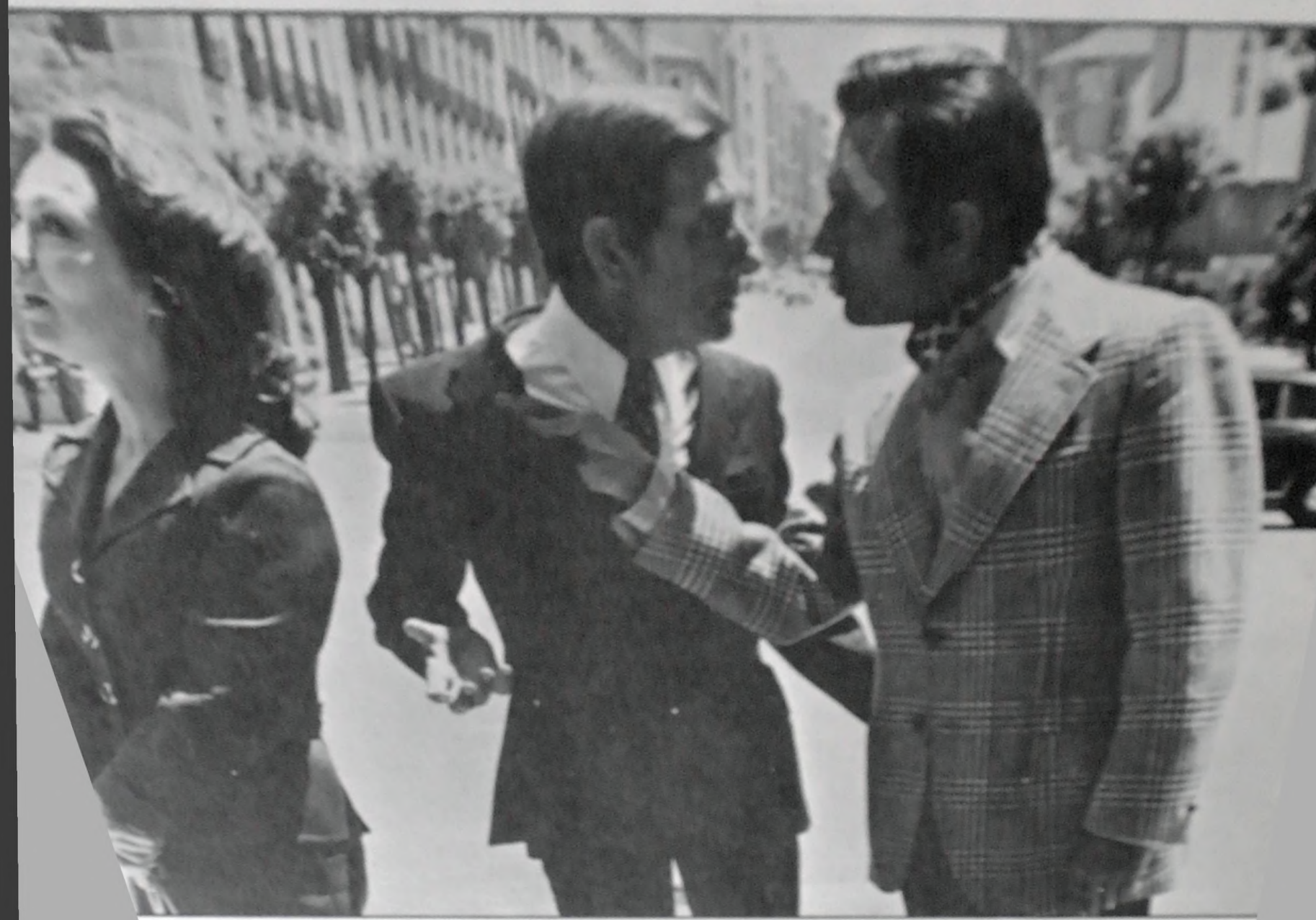
JULITA MARTINEZ - MANOLO GOMEZ BUR - TONY LEBLANC