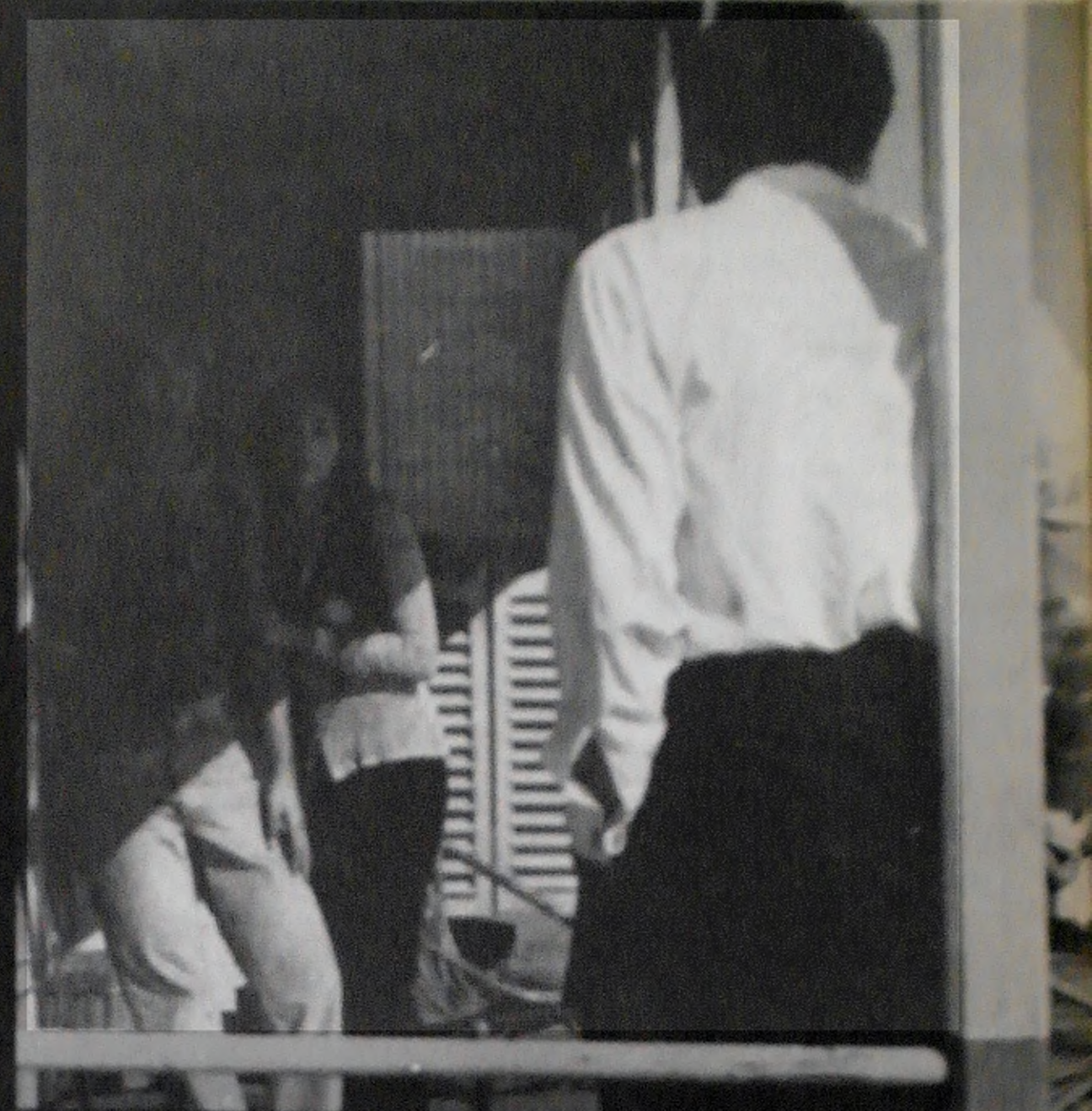
CHRIS MITCHUM - OLIVIA HUSSEY - KARL MALDEN