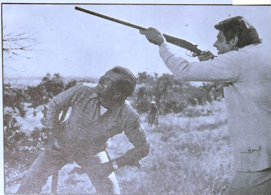
GABRIELLE FERZETTI - JUAN LUIS GALIARDO