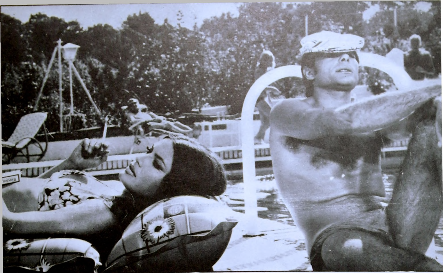
MARISA MELL - JUAN LUIS GALIARDO