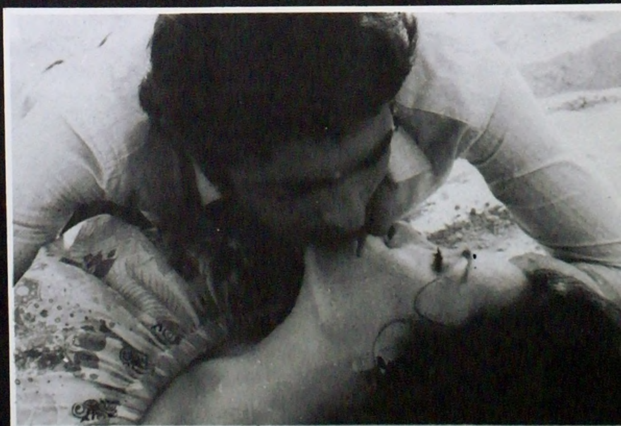
MAXIMO VALVERDE - NURIA ESPERT