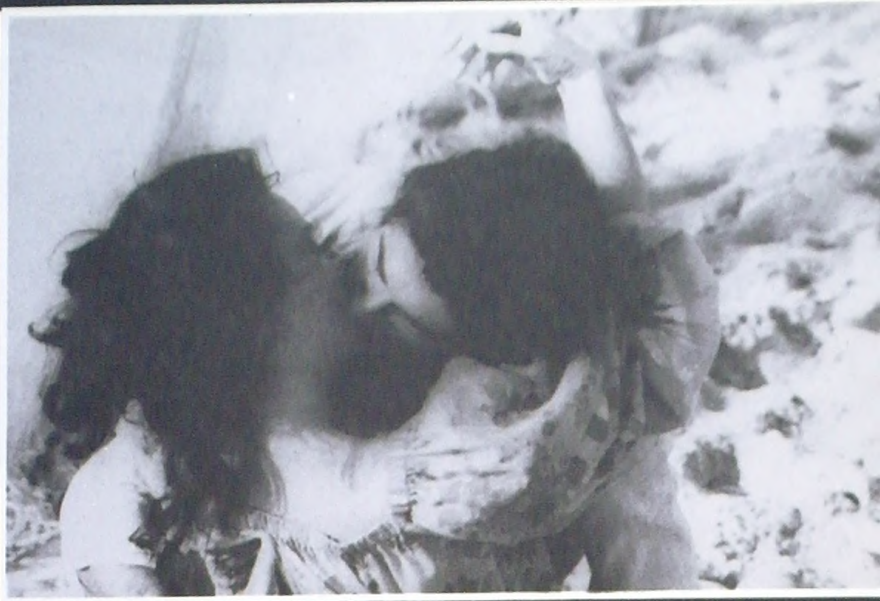
NURIA ESPERT - MAXIMO VALVERDE