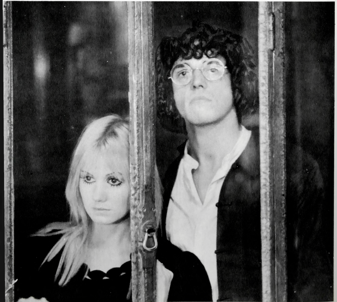
TOU-MIOU - JULIEN CLERC