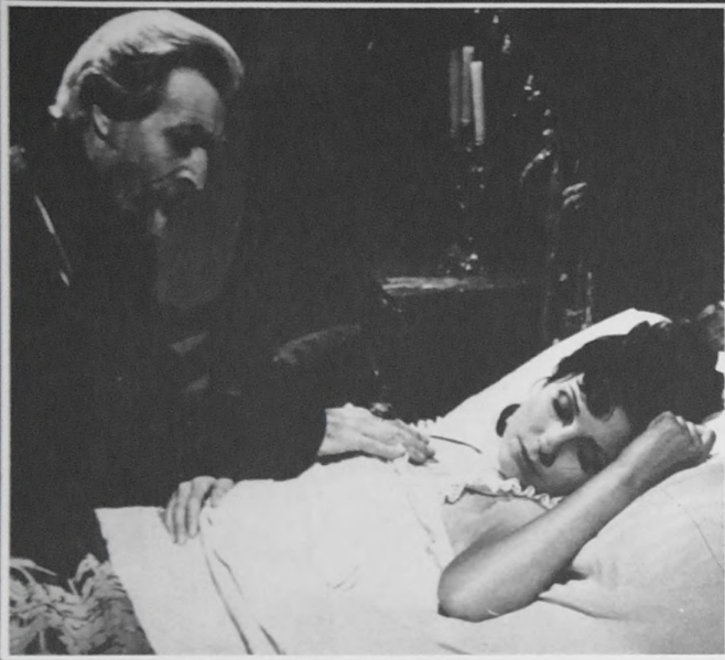
NARCISO IBANEZ MENTA - TINA SAINZ