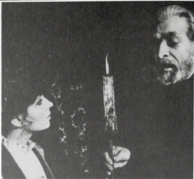
TINA SAINZ - NARCISO IBAÑEZ MENTA