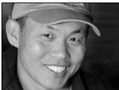
Kim Ki-duk (* 20. prosince 1960)

Kim Ki-duk se narodil na korejském venkově, v 9 letech se jeho rodina přestěhovala do Soulu. Nedokončil školu (žádné oficiální filmové vzdělání nemá), pracoval jako tovární dělník a byl 5 let u námořní pěchoty.