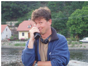
KAREL JANÁK scénarista, filmový a televizní režisér